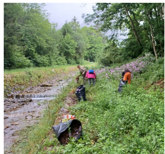
Gruppeneinsatz Nachtviole am Fallbach