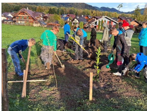
Die Wildhecke mit 30 Pflanzen, bestehend aus zehn unterschiedlichen einheimischen Sträuchern und Gehölzen wurde von den 4. bis 6. Klässlern in einer engagierten Pflanzaktion anlässlich des nationalen Heckentages Ende Oktober angelegt.