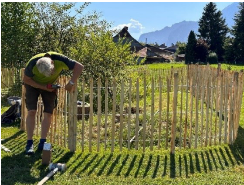
Das Biotop im Schulgarten bietet keine unmittelbare Gefahr mehr, da ein Hag zur Sicherheit der Kinder erstellt worden ist.

Die Bildung durch den Erwerb unterschiedlicher Kompetenzen steht im Vordergrund. Jedoch nicht weniger wichtig ist die, im Schulgarten erforderliche Teamarbeit und Bildung sozialer Kompetenzen. In der gemeinsamen handelnden Tätigkeit und allgemein in der Herausforderung bei Gruppenarbeiten, sind wesentliche Aspekte der sozialen Mitwirkung gefragt. Der Unterricht im Schulgarten findet draussen, an der frischen Luft, ohne begrenzende Wände statt und verschafft Kindern dadurch eine Gelegenheit zum Stressabbau. Das grüne Klassenzimmer fördert etliche Kompetenzen und bietet eine geeignete Plattform für viel Kreativität. Die Entstehung und Pflege des Schulgartens erfordert die Zusammenarbeit von Lehrern, Schülerinnen und Schülern und allenfalls Eltern. Dies fördert das Gemeinschaftsgefühl und die Teamarbeit und ermöglicht andere Formen und Begegnungen untereinander.