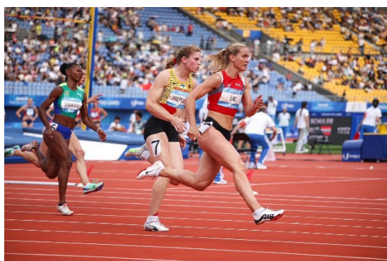
Universiade in Chengdu

4 Nationalstaffeleinsätze an folgenden Meetings: AthleticaGeneve, Team EM Polen, Athletissima Lausanne und Weltklasse Zürich