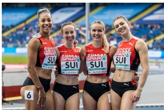
Staffelteam an der EM in Polen